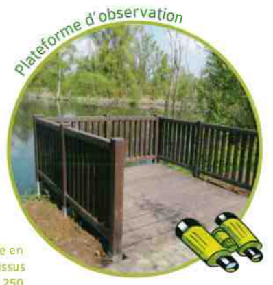
Plateforme élaborée en matériaux recyclés issus du tri sélectif de 43 250 bouteilles d'eau !

La venue de visiteurs sur un site ENS doit être anticipée par la mise en place de moyens d'information et d'observation compatibles avec le respect de la biodiversité et de la quiétude du site. Dans cette perspective, une signalétique a été mise en place (5 panneaux pédagogiques) et une plateforme a été installée pour permettre l'observation des oiseaux.