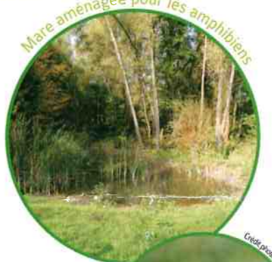
Mare aménagée pour les amphibiens

Les plans d'eau de l'ENS étant peu favorables à la reproduction des amphibiens, une mare a été restaurée afin de leur apporter un habitat favorable. A terme, cette mare devrait favoriser la reproduction des amphibiens et contribuer également au développement de nouvelles plantes et à la venue de nouveaux animaux comme des insectes.