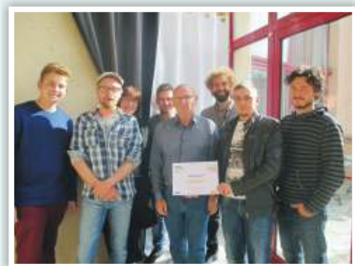
21 octobre 2016 Argancy obtient sa deuxième fleur