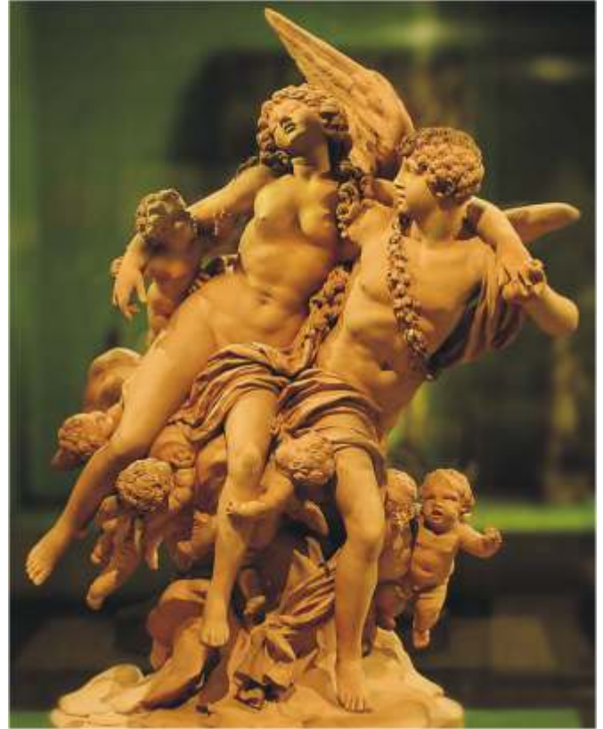
Cupidon et Psyché (terre cuite) Victoria Albert Museum - Londres

Surnommé « le Fragonard de la terre cuite » Clodion est célèbre pour ses sculptures évoquant « le paradis perdu » d'une antiquité rêvée où la vie était rythmée par les fêtes rustiques et les plaisirs galants.