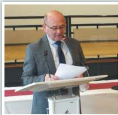
11 mars 2018 Accueil des nouveaux arrivants