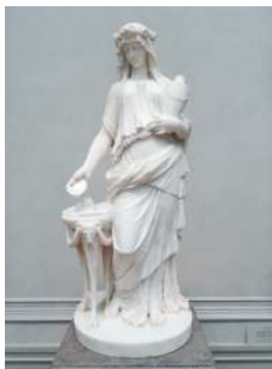
Une Vestale (marbre) National Gallery of Art Washington

Clodion préfère reprendre les défauts du modèle pour animer les beautés froides et muettes. Ses draperies sont proches du corps, soulignant ses lignes, tout en travaillant la superposition des matières et le jeu des plis, sans effets inutiles.