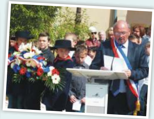
8 mai 2015 Commémoration du 8 mai 1945