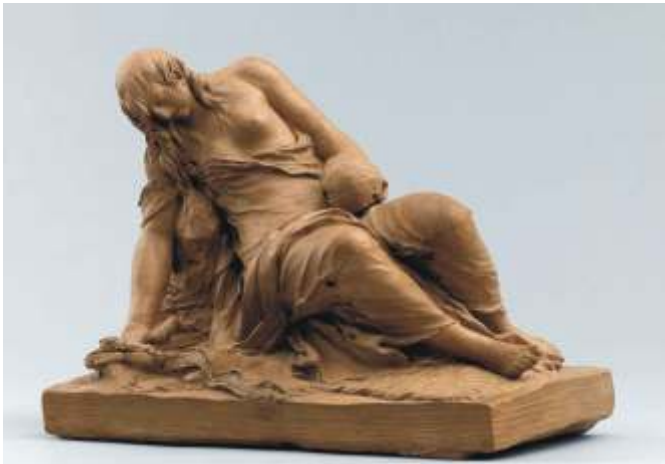
Sainte Marie Madeleine (terre cuite) Musée du Louvre

Grâce à l'esprit léger de ses compositions et à la virtuosité de leur exécution, il séduit très vite les collectionneurs de son temps (dont Catherine II de Russie). Toutefois, il sait que son avenir dépend plus de mécènes privés français ou étrangers, que de commandes royales. Voilà une des raisons pour lesquelles on peut voir ses œuvres à Paris, Londres, Chicago, New York, Saint Pétersbourg, Stockholm ou Copenhague... et, au Musée des Beaux-Arts de Nancy.