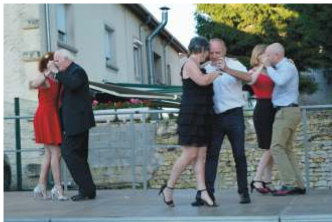
Démonstration de Tango argentin