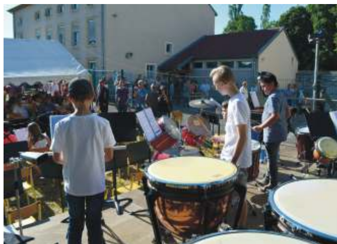
Félicitations à nos jeunes diplômés

La fête s'est terminée par un repas pris en commun avec les professeurs, les élèves et leurs parents ainsi que les membres du conseil d'administration.