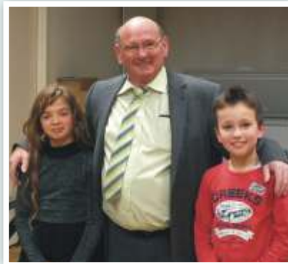
19 décembre 2014 Vœux au personnel communal