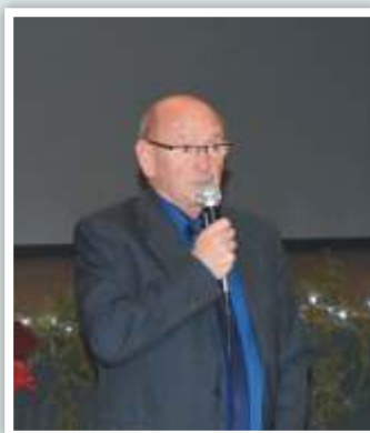
22 décembre 2017 Vœux au personnel communal et aux associations