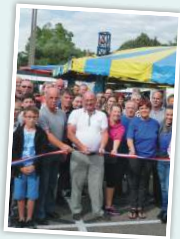
Inauguration de la fête patronale 2015