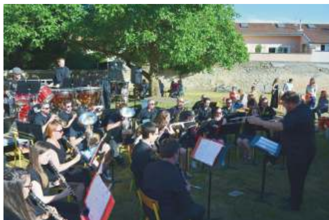
Participation de Vents d'Est

24 juin, fête de fin d'année pour les élèves de la classe d'éveil musical.