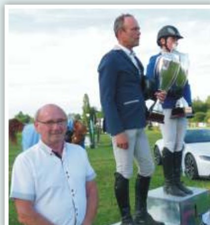
23 juin 2019 Remise du Prix d'Argancy lors du concours hippique organisé par l'ACP d'Olgy