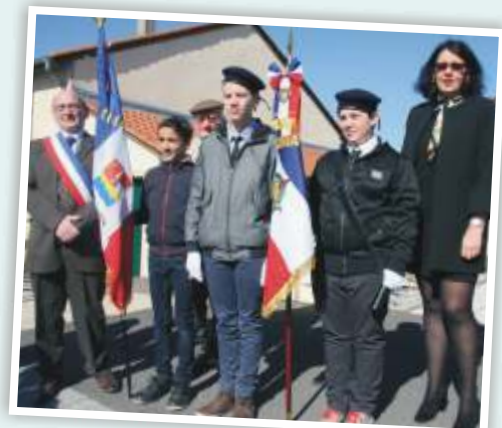
7 avril 2018 Remise du drapeau du Groupe Scolaire d'Argancy